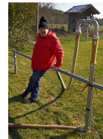
Brunnenbohrung war erfolgreich