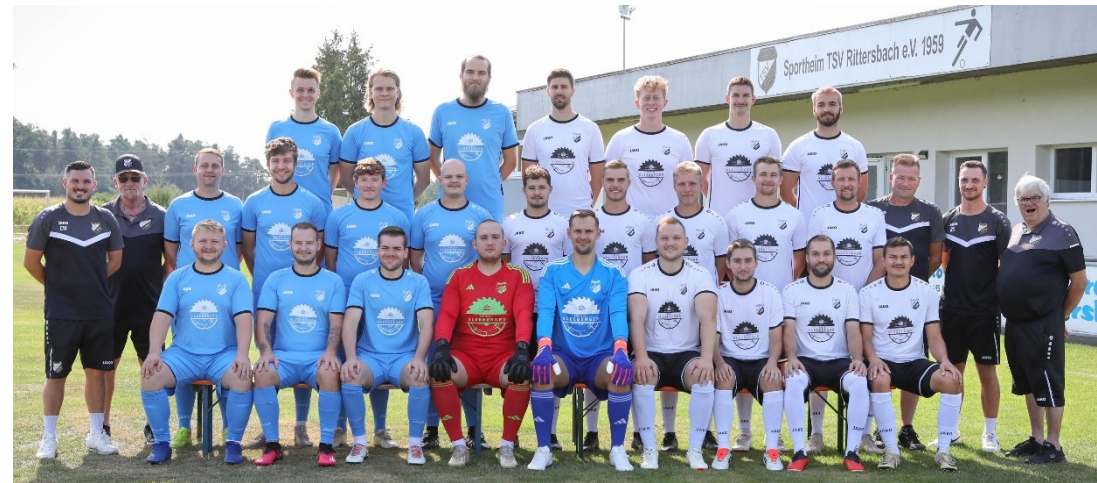
1. & 2. Mannschaft Saison 2024/2025

TSV Rittersbach präsentiert sein vielseitiges Angebot. Vielen Dank an alle Trainer/-innen und Betreuer/-innen