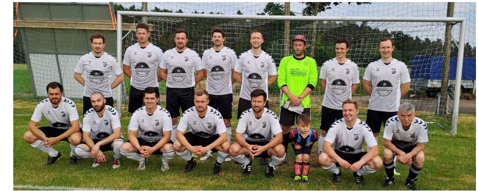
AH-Mannschaft am 09.06.2023 vor Spiel gegen TSV Georgensgmünd AH