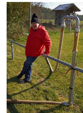
Brunnenbohrung war erfolgreich